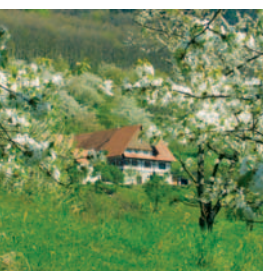
Kirschblüte im Frühling